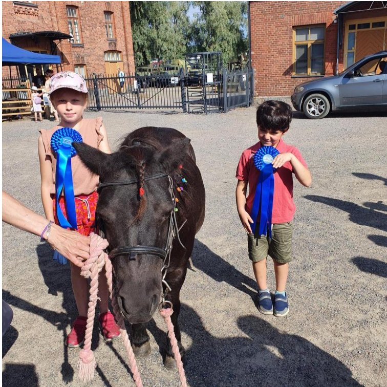
Ponin koristelukilpailun osallistujat ylpeinä ruusukkeistaan